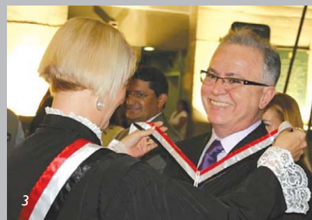
Ordem do Mérito Judiciário TRT/SP - 2007