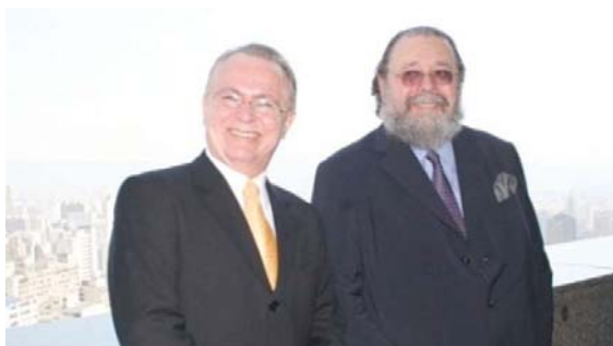
Com o Ministro Eros Grau do STF