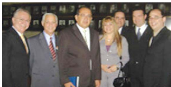
2. Com o Presidente do TRT/SP e lideranças da Magistratura paulista, por ocasião de audiência com o Ministro Gilmar Mendes