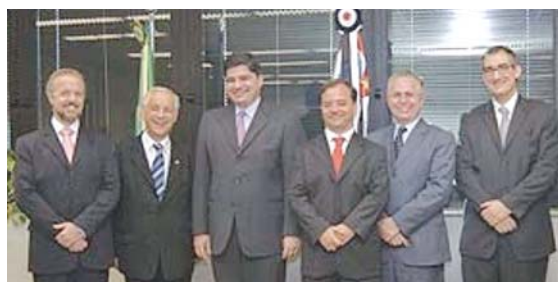
1. Presidente e Secretário Geral do TRT/SP e lideranças da advocacia paulista

Atualmente exerce a função de Assessor de Planejamento e Gestão Estratégica do mesmo órgão, atuando constantemente junto a outras personalidades do mundo jurídico em busca de soluções para a atividade judicante. ■